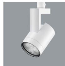
Parscan InTrack Strahler und Wandfluter