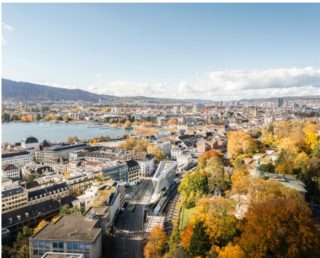
„Haus zum Falken” dopełnia urbanistycznie Stadelhofer Platz i łączy przestrzeń publiczną od Jeziora Zuryckiego aż po operę.

Andreas Scheib | Glas Trösch Holding AG Dyrektor ds. komunikacji / CCO Industriestrasse 29 | CH-4922 Bützberg press@glastroesch.com