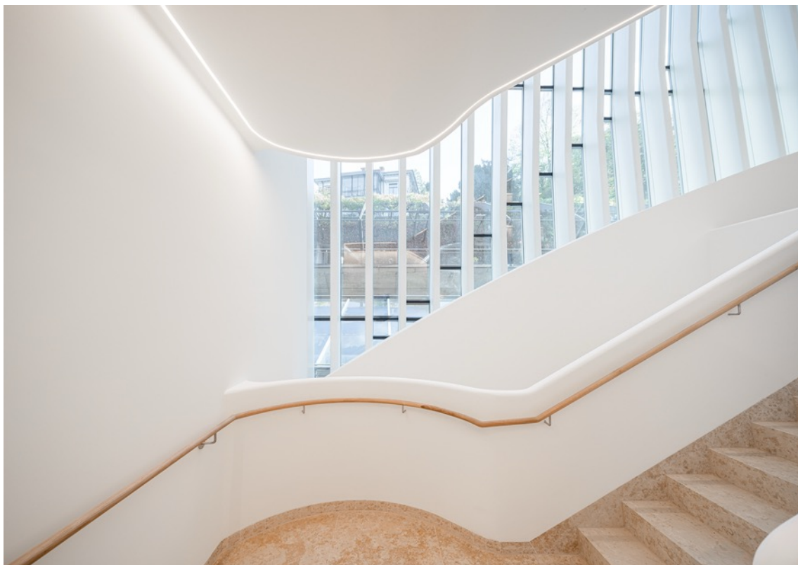
Czteropiętrowe atrium oraz przypominająca rzeźbę klatka schodowa stanowią przestrzenne serce budynku.