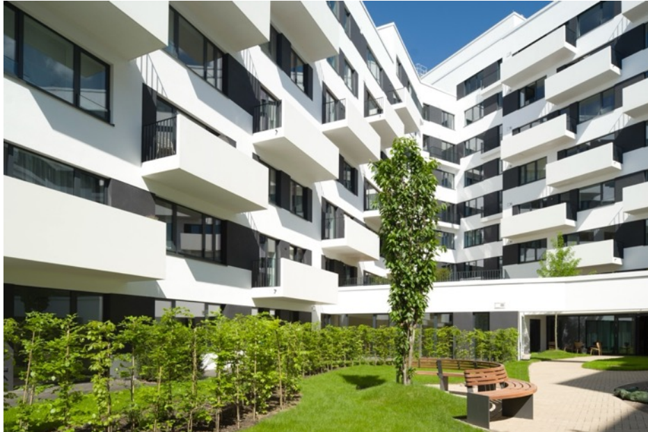
Der Innenhof des Wohnhauses „Eleven Decks“ lädt mit viel Licht und Grün zum Verweilen ein.

SANCO Beratung | Glas Trösch GmbH Im Lehrer Feld 30 | 89081 Ulm, Deutschland +49 (0)731 4096 147 info@sanco.de