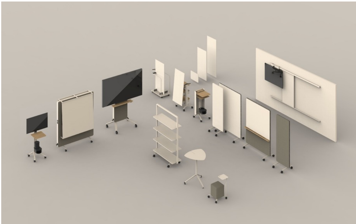
Gesamtübersicht Programm Confair Next (Design: Wilkhahn): Der gestaltbare, präzise aufeinander abgestimmte „Werkzeugkasten“ zur Förderung der kreativen Zusammenarbeit. Abbildung: Wilkhahn

Bad Münders, August 2024. Im Zentrum des Messeauftritts von Wilkhahn steht die Präsentation von Confair Next. Der durchgängig und hochwertig gestaltete „Werkzeugkasten“ ergänzt mit seinen flexibel und selbstorganisiert nutzbaren Raummodulen die Einrichtung von Kommunikations- und Kollaborationsbereichen.